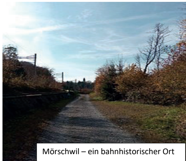
Mörschwil – ein bahnhistorischer Ort

Nach rund zweistündiger Marschzeit bietet sich in der Nähe des Nonnensteiges eine erste Möglichkeit, den Marsch zu beenden. Wer sich insgesamt 4½-Stunden Wanderzeit zumutet, zieht den Weg weiter durchs Tal der Steinach und über Reggenschwil ins recht wilde Galgentobel.