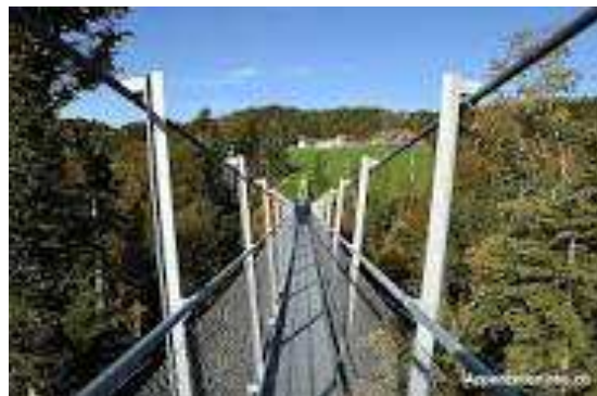
Die imposante Hängebrücke zwischen Grub und Heiden.

Tel. 071 455 22 41 oder martin-meier@bluewin.ch