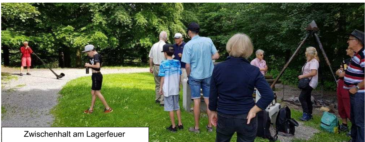
Zwischenhalt am Lagerfeuer

Wir planen bereits weitere «BERGLAUF-Anlässe», u.a. am 29.8.2020 eine Wanderung von Berg nach Heiden. Weitere Informationen folgen!