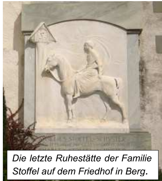
Die letzte Ruhestätte der Familie Stoffel auf dem Friedhof in Berg.

Lt Stoffel war arg vom Pech verfolgt. In Folge zweier Stürze am dritt- und letzten Hindernis und Zeitüberschreitung steckte er nicht weniger als 66 Strafpunkte ein. Ein gelungener zweiter Durchgang verhinderte ein Debakel.