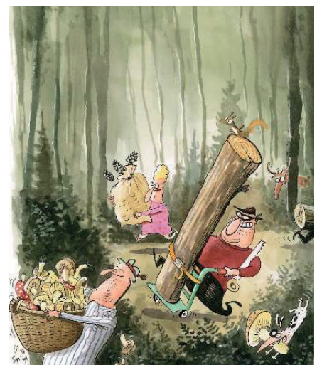
Wir sammeln und pflücken mit Mass