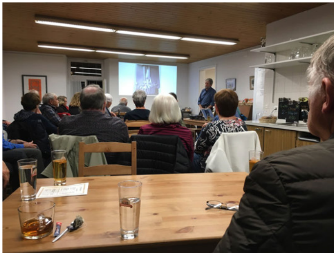
Foto: Fredi erzählte, und alle hörten währen einer Stunde gespannt zu.

Seelenruhig stand dann Fredi vor die Gäste und erzählte auf eindrückliche und unterhaltsame Weise von seinem Werdegang und seinen «krummen und geraden» Wegen vom Lehrling bis zum Meister.