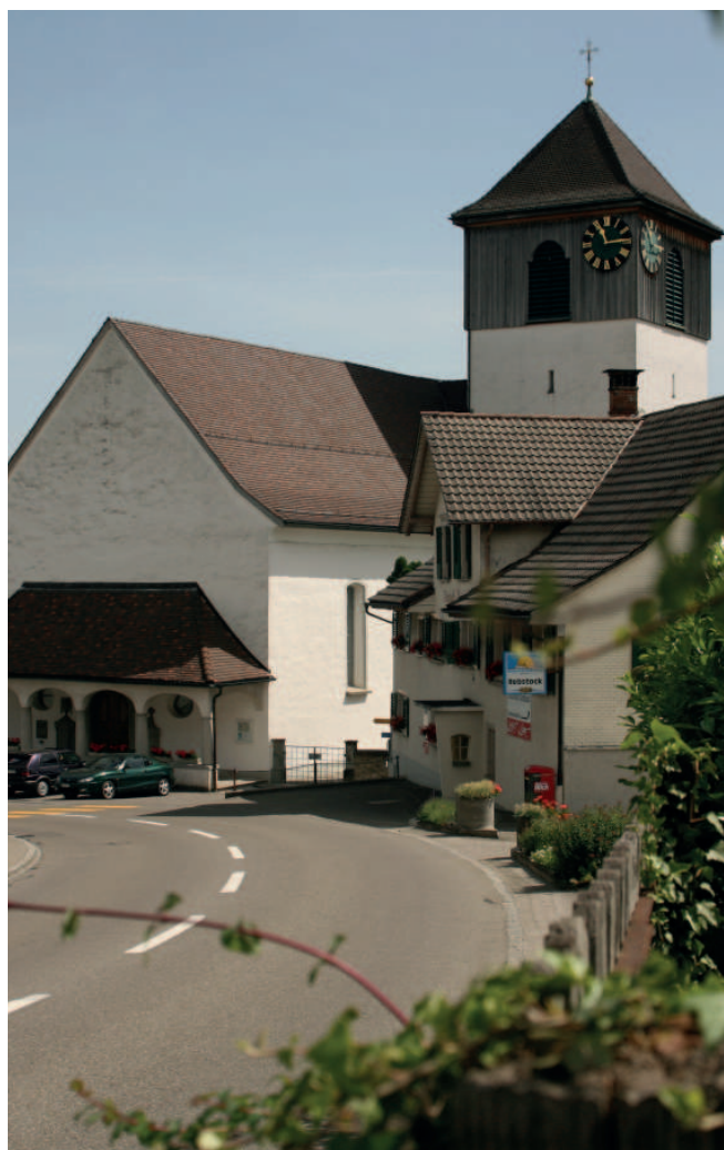
Bild der kath. Kirche Berg und Restaurant Rebstock

Freitag, 16.06.2017 , 09.00 Uhr Eucharistiefeier