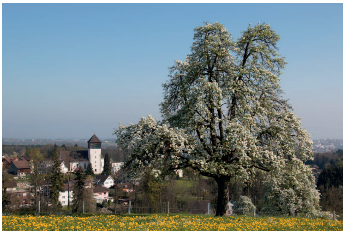
Kath. Kirche Berg SG im Hintergrund

09.00 Uhr Eucharistiefeier anschliessend Kaffee im Pfarreisaal