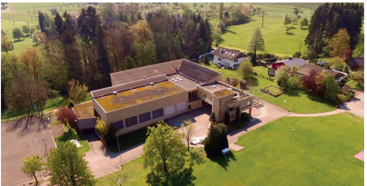
Vogelperspektive Schulhaus Brühl, Foto: Cilian Gnägi