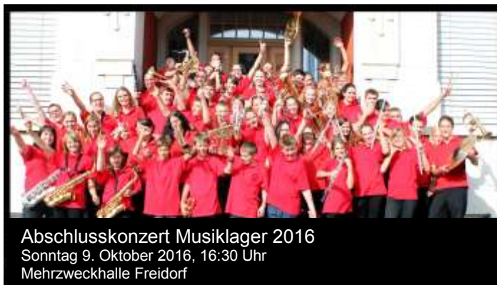
Abschlusskonzert Musiklager 2016 Sonntag 9. Oktober 2016, 16:30 Uhr Mehrzweckhalle Freidorf

Kinder und Jugendliche aus den Musikvereinen Andwil-Arnegg, Bernhardzell, Waldkirch und Berg verbringen 5 Tage zusammen, welche ganz im Zeichen von Musik, Spiel und Spass stehen.