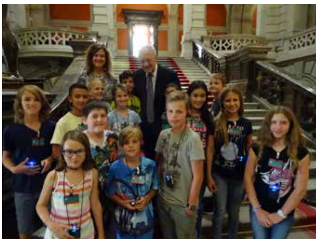
Bundespräsident Schneider-Ammann begrüsst die Klasse

Punkt 07.00 Uhr standen die Fünfteler und Sechsteler der Primarschule Berg SG auf dem SOB-Perron in Roggwil-Berg. Die Vorfreude auf eine spannende Woche voller Abenteuer mit der ganzen Klasse war gross. Bereits auf halber Strecke wartete das erste Highlight auf uns: Mitten im Hauptbahnhof Zürich betraten wir einen stillgelegten Autobahntunnel, genossen bei herrlichstem Sonnenschein die Aussicht vom Dach der Bahnhofhalle und lernten viel über diesen bedeutenden Verkehrsknotenpunkt der Schweiz. Die Zugfahrt nach Bern ging mit Schwatzen, Lachen, Singen und Spielen wie im Flug vorbei. Bald schon wartete der Bärengraben auf uns. Eines der mächtigen Tiere würdigte unseren Klassen-Song „Bär vo Bern“, indem es sich anschaulich präsentierte. Am bekannten Münster vorbei spazierten wir zum Bundeshaus, wo uns aufschlussreiche Blicke hinter die Polit-Kulissen gewährt wurden. Was wir in „Mensch und Umwelt“ gelernt hatten, konnten wir live sehen und so vor Ort unser Wissen vertiefen. Siehe da: Bundespräsident Schneider-Ammann posierte sogar für ein Foto mit unserer Klasse! Im Nationalratssaal erlebten wir auf der eigens für uns reservierten Zuschauertribüne die Eröffnung der Herbstsession. Danach machten wir uns auf zum Zielort Biel/Bienne. 45 Minuten später bezogen wir das Pfadfinderheim „Orion“ und durften uns über einen gelungenen und erlebnisreichen Start in unser Klassenlager 2016 freuen. Am Abend schrieben wir zufrieden Ansichtskarten nach Hause.