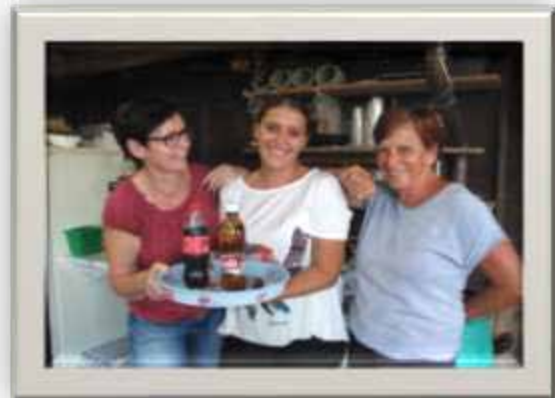
Sie strahlten mit der Sonne um die Wette

Der Pistolenschützenverein Berg 9305 Berg SG