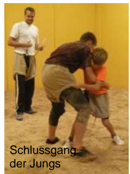
Schlussgang der Jungs