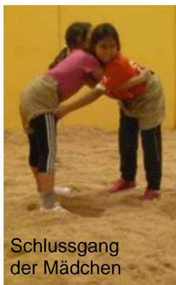
Schlussgang der Mädchen