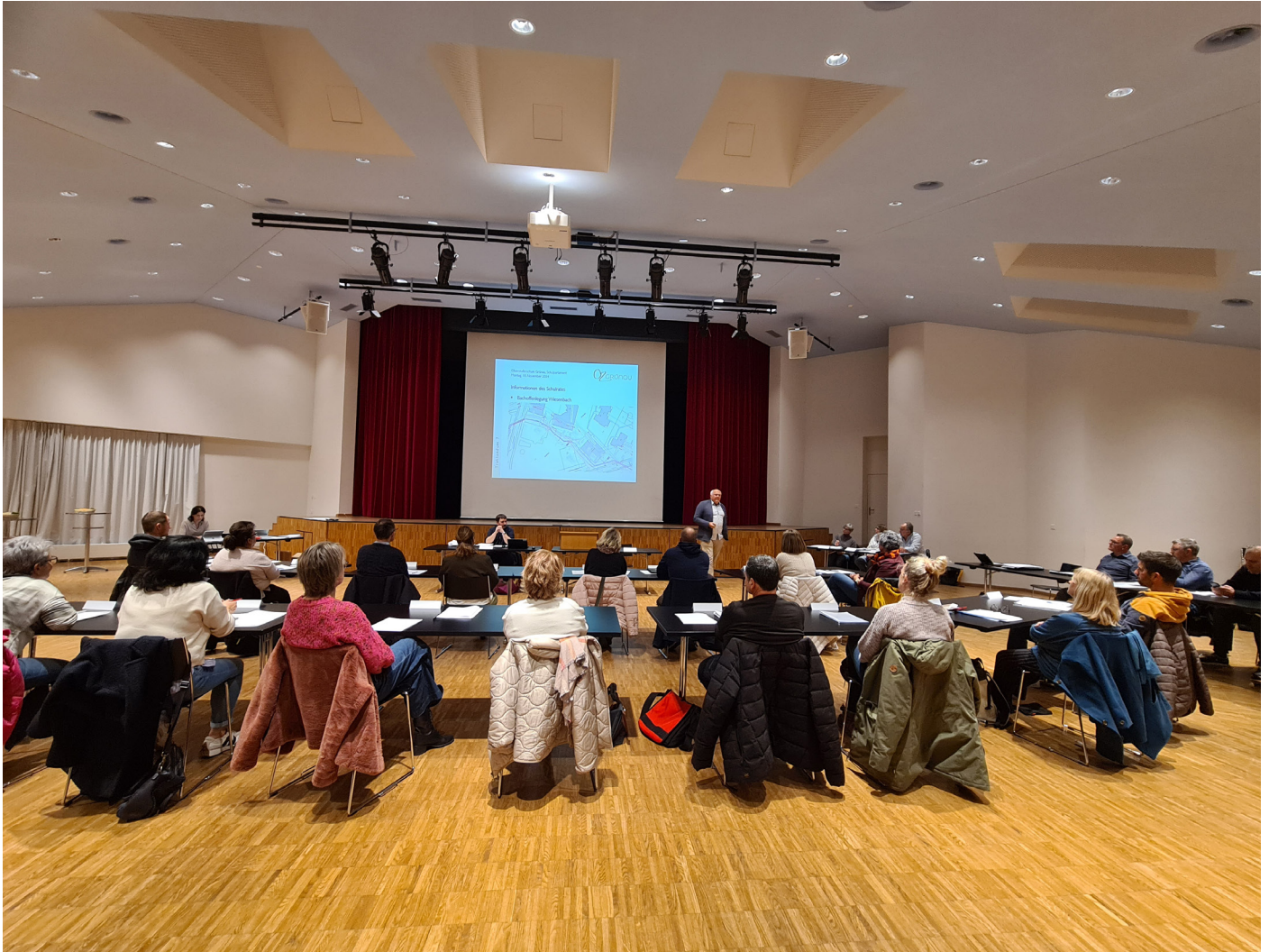
Oberstufenschule Grünau Schulverwaltung

Nach der Sitzung wurden alle Anwesenden zu einem Apéro eingeladen.