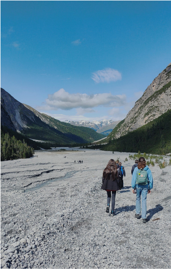
Wanderung im Val Minger, S3b