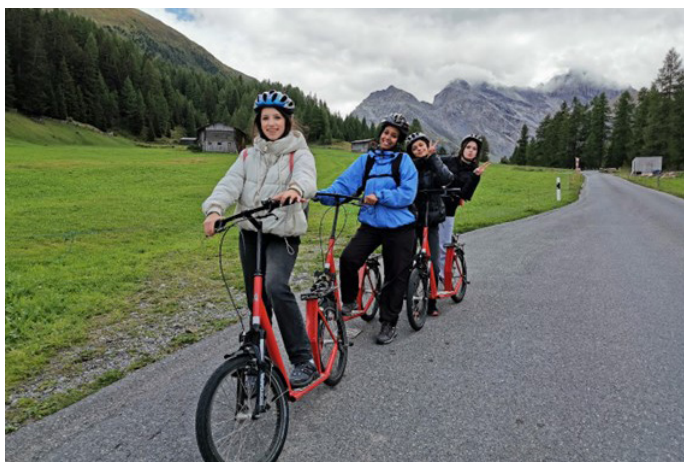
Trottinettfahrt Sertigtal, R3ab