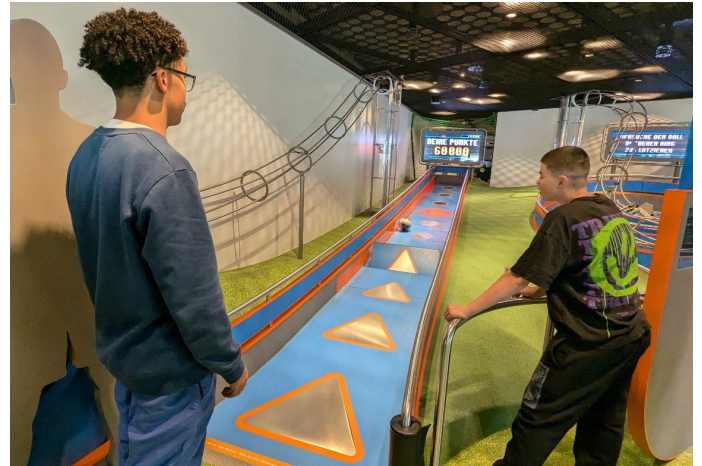
Besuch Fifa Museum, R3C