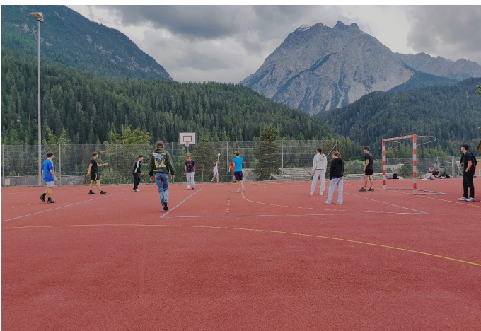
Spiel und Sport, S3b