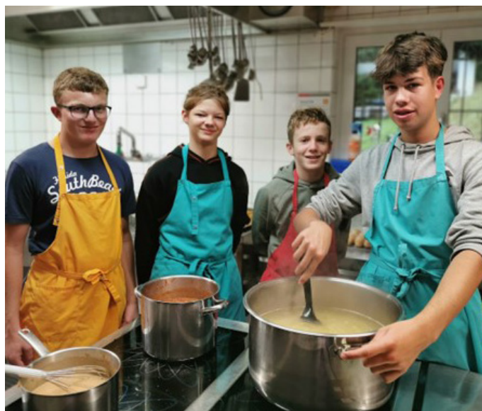
Ämtli Kochen, R3b

Anstelle von Worten lassen wir Bilder sprechen. Lagerorte: S3ac: Bever, S3b: Scuol, R3a: Küsnacht, R3ab: Davos.