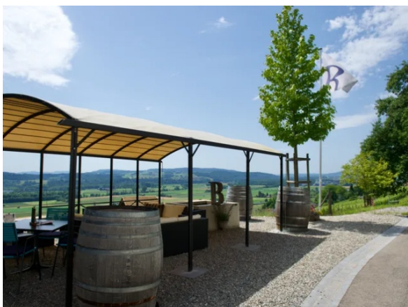
Thurgauer-Rebbauern laden ein

Alle können dabei sein. Wer den Genuss erleben will, trifft sich am letzten Augustsamstag (31.8.) um 9.20 Uhr auf dem Bahnhof Arbon. «Turbo» bringt uns nach Weinfelden zum Start des Weinweges. Am Bahnhof erwerben wir uns für Fr. 21.- den speziellen Rucksack, welcher uns berechtigt, an zwei Weinsafes edle Tropfen zu geniessen. Ein Weinglas und Chips finden wir ebenfalls im erworbenen Präsent.