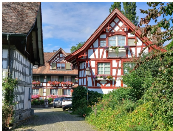
Riegelbauten in Ottoberg

durch eine erste Weindegustation unterbrochen, bevor wir gegen Mittag den Gasthof «Haldenhof» in Ottoberg erreichen. Nach einem Verpflegungshalt geht es auf den Heimweg, wo nochmals ein Rastplatz mit Weinverköstigung auf uns wartet.