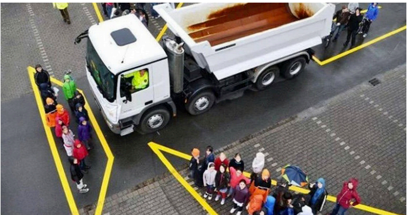
Diese Bild illustriert sehr gut was der LKW Fahrer nicht sehen kann!

Die Gefahr des toten Winkels bei LKWs ist real und kann schwerwiegende Unfälle verursachen. Durch erhöhte Achtsamkeit und gezielte Instruktionen können Fussgänger, Eltern und LKW-Fahrer dazu beitragen, solche Unfälle zu vermeiden. Achten Sie im Umfeld von LKWs stets auf Ihre Sicherheit und die Ihrer Kinder.