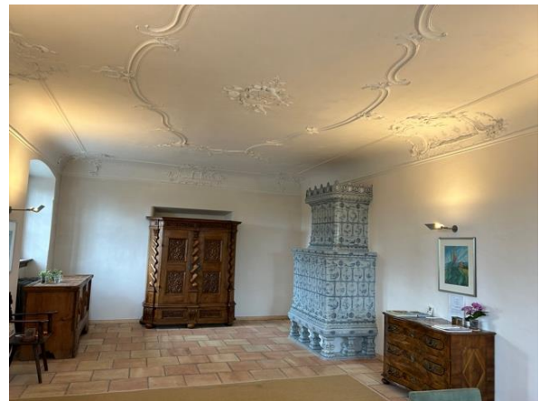
Schlosssaal im Gossen Hahnberg